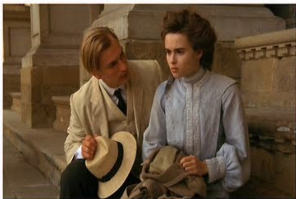
Julian Sands e Helena Bonham Carter in “Camera con vista”

Le sale dell'Istituto di Cultura Italiana di Los Angeles ospiteranno fino all'8 marzo una installazione di molte centinaia di cappelli di paglia che saranno personalizzati “dal vivo” da esperte modiste a seconda dei gusti del pubblico, la proiezione di “Hats on Film” un film realizzato con il montaggio serrato di momenti celebri della storia del cinema in cui il cappello è il “protagonista”, curato dalla Film Commission della Regione Toscana; infine una mostra fotografica sulle lavorazioni e sui cappelli d'epoca con una selezione di immagini storiche.