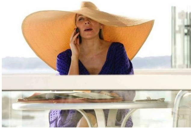
Kim Cattrall in "Sex and the City"

“Quando penso a un bel cappello di paglia, è italiano. I cappelli di paglia più eleganti sono sempre stati realizzati dalla paglia ‘Leghorn’ di Livorno, una città sulla costa non lontana da Firenze, e adoro l’idea che gli artigiani che lavoravano il cuoio spesso facevano anche cappelli. Per me, il cappello di paglia perfetto rappresenta l’essenza de “La Dolce Vita”, dormire all’ombra di un albero un pomeriggio d’estate a Fiesole...”