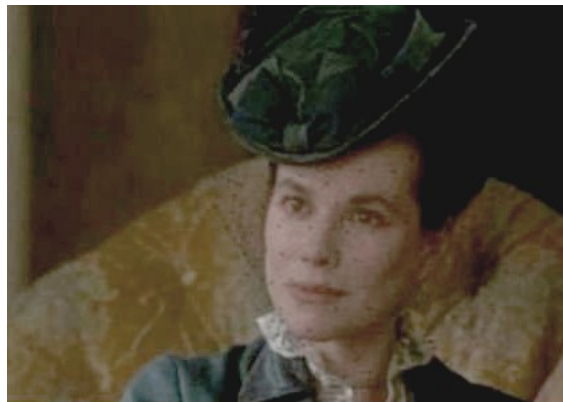
Barbara Hershey in “Ritratto di Signora”

La mostra rientra nelle manifestazioni ufficiali dell’ “Anno della Cultura Italiana negli Stati Uniti: 2013” promosse dal Ministero degli Affari Esteri, unico progetto sull'artigianato scelto per portare Oltreoceano un'idea di manufatto ancora oggi realizzato tradizionalmente ma con grande attenzione alla contemporaneità.